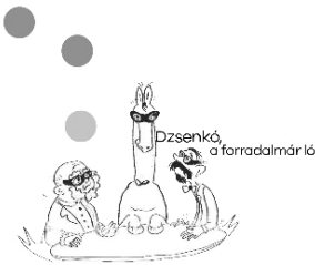
Dzsenkő, a forradalmár ló