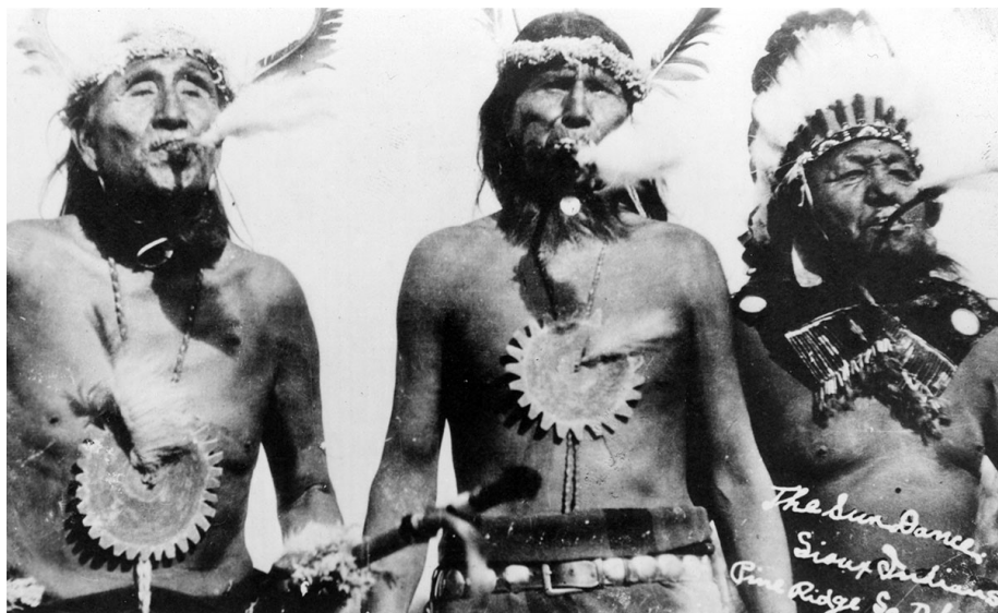
1. kép. Lakota naptánc szertartás résztvevői (1900 k.).

„Fehér Bölényborjú Asszonyt jelképezi” 43 , pedig a pipát viszi a felkészülési terekből a szertartási kunyhóba.